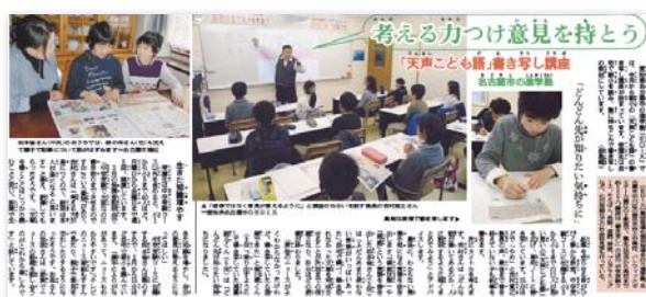
▲40人の小学生が塾での講座を受講するために、自宅購読しています

※名古屋市の「EDIX」や神奈川県Gゼミナールでは、「天声こども語書き写し講座」などの講座を開講し、塾生は朝日小学生新聞の購読が条件になっています。保護者説明会では、塾での新聞活用について、「好評だった」とのことです。